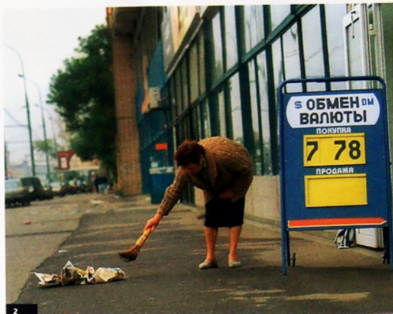
2. Кризис 1998 года никто не мог предсказать, он был внезапным

рынка. Отток капитала из страны еженедельно составлял 650 млн долларов.